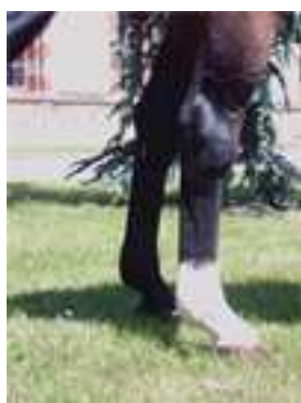
Jarret droit et sur les boulets,